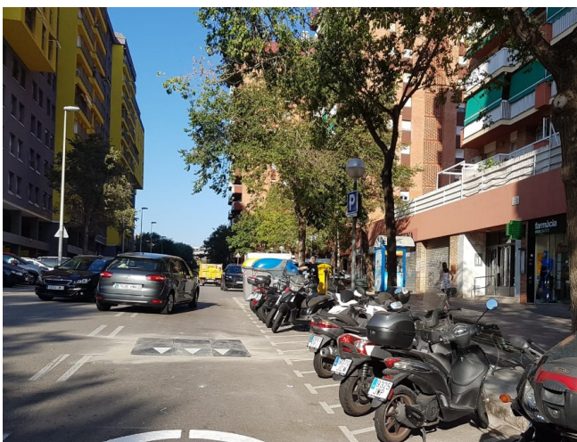
Col·locació de senyalització (horitzontal i vertical)