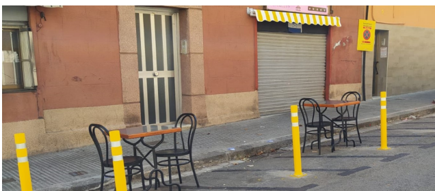
Col·locació de pilones