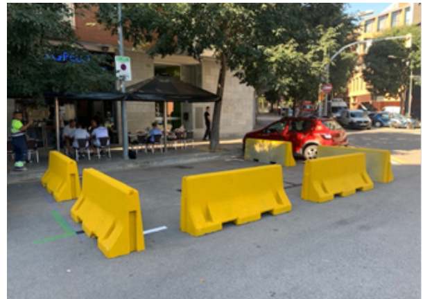
Col·locació de New Jerseys