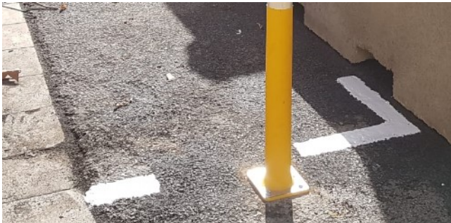
Pintat de línies de terrasses